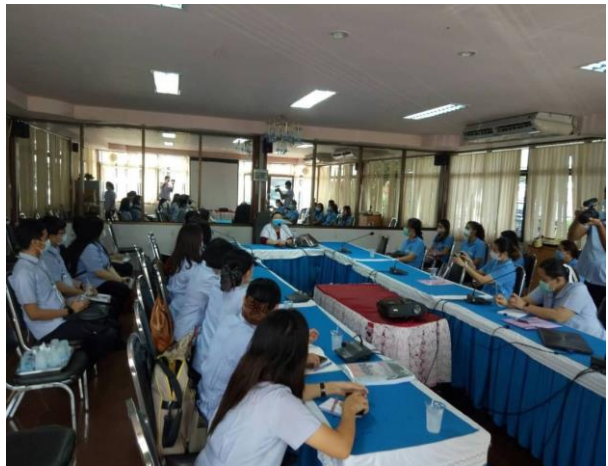
ผู้บริหารถ่ายทอดนโยบาย” ปัญหาอยากแก้ ความดีที่อยากทำ” กลุ่ม STRONG ชุมแสงร่วมใจ โปร่งใส ไม่ทุจริต ตามกรอบ (ITA)