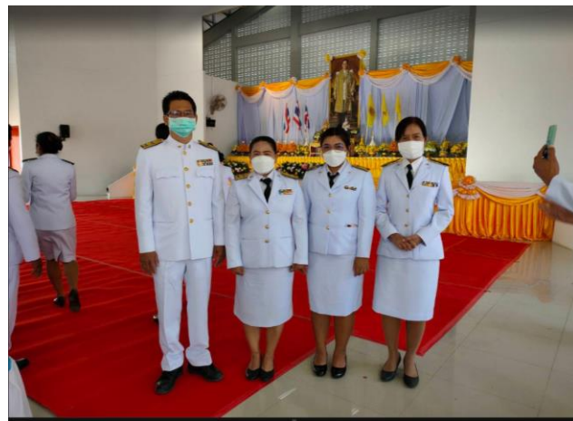
ส่งเสริมกิจกรรมเทิดทูนสถาบันชาติ ศาสนา พระมหากษัตริย์ โดยร่วมประกอบพิธีการรักษาศีลตามหลักศาสนา