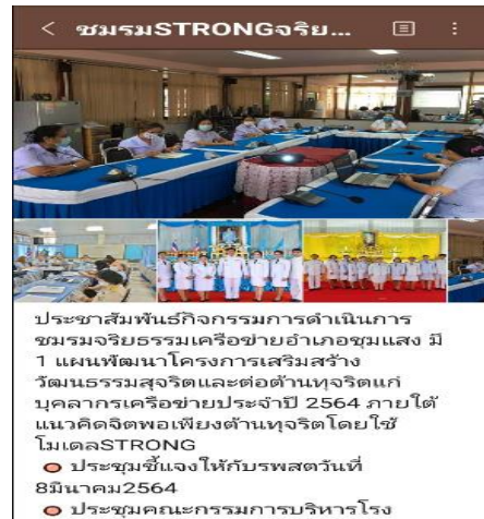
ประชาสัมพันธ์ชมรมจริยธรรม กลุ่ม STRONG ชุมแสงร่วมใจ